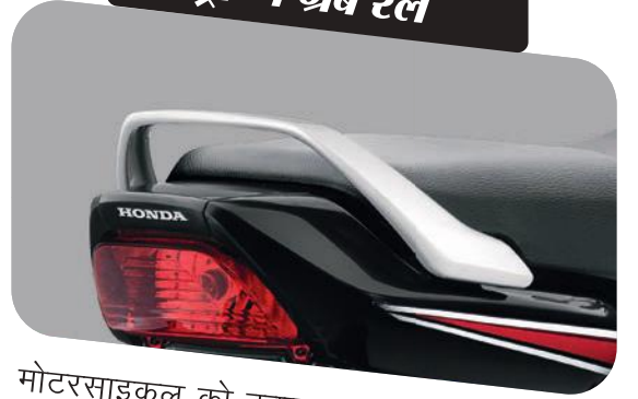
स्ट्रॉन्ग ग्रैब रेल