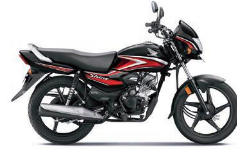
रेड के साथ ब्लैक