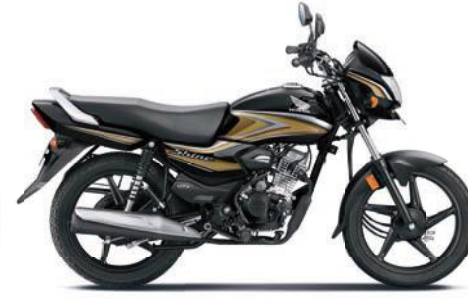
गोल्ड के साथ ब्लैक