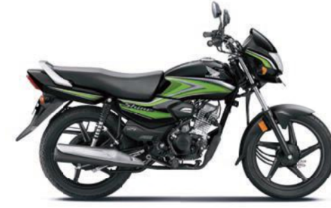
ग्रीन के साथ ब्लैक