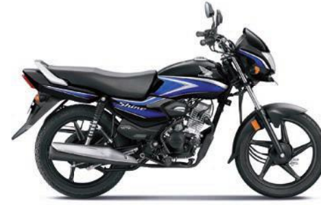
ब्लू के साथ ब्लैक